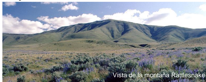
Vista de la montaña Rattlesnake

El 15 de mayo de 1989, el Departamento de Energía de EE. UU., la Agencia de Protección Ambiental de EE. UU. (EPA) y el Departamento de Ecología (Ecología) del Estado de Washington firmaron un acuerdo integral de limpieza y cumplimiento para Hanford Site, en el sureste del estado de Washington. El acuerdo, titulado Acuerdo de Instalación Federal de Hanford y Orden de Consentimiento (también conocido como Acuerdo Tripartito [TPA]), es un acuerdo para lograr el cumplimiento de las disposiciones de acción correctiva de la Ley Federal de Compensación y Responsabilidad de Respuesta Ambiental Integral (CERCLA) y con la Ley Federal de Recursos Ley de Conservación y Recuperación sobre reglamentos de las unidades de tratamiento, almacenamiento y eliminación, y las disposiciones de acción correctiva.