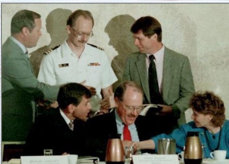
Representantes del Departamento de Ecología de Washington, del Departamento de Energía de los EE. UU. y de la Agencia de Protección Ambiental de los EE. UU. firmaron el Acuerdo Tripartito en 1989.