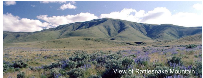
View of Rattlesnake Mountain

On May 15, 1989, the U.S. Department of Energy (DOE), U.S. Environmental Protection Agency (EPA) and Washington State Department of Ecology (Ecology) signed a comprehensive cleanup and compliance agreement for the Hanford Site in southeastern Washington state. The agreement, titled the Hanford Federal Facility Agreement and Consent Order (aka Tri-Party Agreement [TPA]), is an agreement for achieving compliance with the federal Comprehensive Environmental Response Compensation and Liability Act (CERCLA) remedial action provisions and with the federal Resource Conservation and Recovery Act treatment, storage and disposal unit regulations and corrective action provisions.