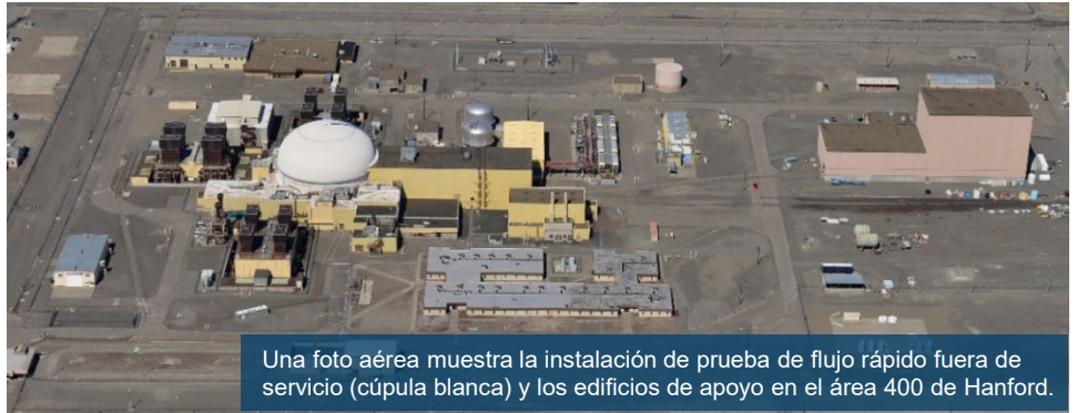
Una foto aérea muestra la instalación de prueba de flujo rápido fuera de servicio (cúpula blanca) y los edificios de apoyo en el área 400 de Hanford.

El Departamento de Energía de EE. UU. (DOE) está llevando a cabo un período de comentarios públicos de 30 días sobre una evaluación de ingeniería/análisis de costos (EE/CA) que evalúa alternativas para acciones de remoción en las que el tiempo no sea un factor crucial para nueve estructuras en el complejo de instalaciones de prueba de flujo rápido (FFTF) en el área 400 de Hanford.